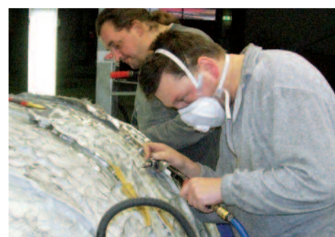
Mitarbeiter der Arnold AG polieren das „Baroque egg“