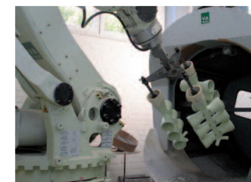
Ein robotergestützter und klimatisch optimierter Dauerbetrieb ermöglicht ausgeweitete Produktionskapazitäten