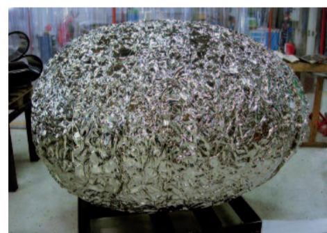
Das fertig polierte „Baroque egg“