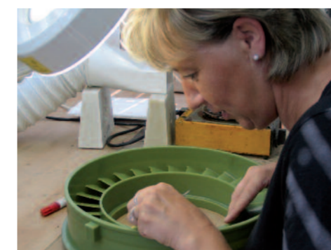
Am Anfang steht die Modellierung eines Wachsmodells – hier für einen Düsenring

Um dieses wichtige Arbeitsfeld der SCHMOLZ + BICKENBACH-GUSS-Gruppe auch in Zukunft zu fokussieren, investierte das Unternehmen am Standort Ennepetal kürzlich in eine mit neuen, hochmodernen Komponenten ausgestattete und erweiterte Feingussanlage. Vorteile für den Kunden: Die neue Anlage erlaubt es, Gussteile von bis zu 25 kg zu fertigen. Der robotergestützte und klimatisch optimierte Dauerbetrieb ermöglicht erheblich ausgeweitete Produktionskapazitäten – das bedeutet eine Leistungssteigerung von ca. 100 Prozent. SCHMOLZ + BICKENBACH GUSS ist damit in der Lage, komplexe Projekte auch kurzfristig zu realisieren. Das heißt, dass die produktionstechnische Lücke zwischen dem klassischen Rapid-Prototypen und dem Serienfeingießern praktisch geschlossen wurde.