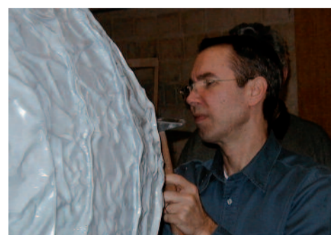
Jeff Koons in Aktion

Eine besondere Herausforderung sind hier die geforderte Brillanz im Polierbild und die Gleichmäßigkeit der Teile untereinander. Das „Baroque egg“ wurde in zwei Hälften zu je 2.000 kg gegossen, das Endgewicht der 1.900 x 1.600 mm großen Skulptur liegt bei 1.400 kg. Das gegossene und vorgeschliffene Rohstück lieferte SCHMOLZ + BICKENBACH GUSS an die Arnold AG, die Politur, Montage und Lackierung vollendete. In monatelanger Arbeit schlifften, polierten und färbten 30 Schlosser und Lackierer den Edelstahlkörper auf Hochglanz. Beeindruckendes Resultat: eine über die komplette Kontur spiegel- und verzerrungsfreie Oberfläche. Heute ist das Kunstwerk in den großen Museen dieser Welt zu sehen. Neben dem „Baroque egg“ verwirklichte SCHMOLZ + BICKENBACH GUSS in der Zwischenzeit folgende Projekte von Jeff Koons: Tulips (Strauß von sieben Tulpenblüten), Hanging Heart, Cracked Egg, Secret Heart (Herz in Zellophanhülle).